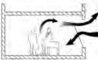
Einseitige Belüftung von Räumen über ein Fenster

Bei der Belüftung von Räumen über ein Fenster strömen die frische und die verbrauchte Luft über das gleiche Fenster ein bzw. wieder aus. Wie viel Luft so ausgetauscht werden kann, hängt vom freien Querschnitt, dem Temperaturunterschied zwischen drinnen und draußen und der Windgeschwindigkeit ab. Bei der Stoßlüftung wird der Flügel ganz geöffnet. Die Kipplüftung erfordert für den gleichen Luftaustausch einen mehrfachen Zeitraum und sie kann dadurch zu hohen Energieverlusten führen.