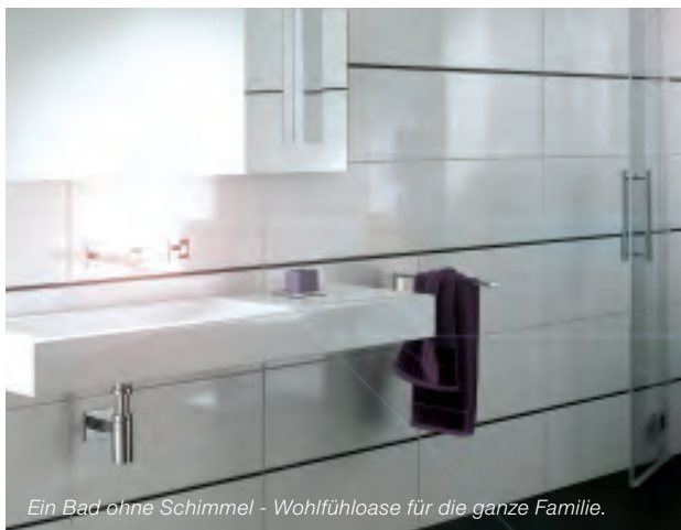
Ein Bad ohne Schimmel - Wohlfühloase für die ganze Familie.